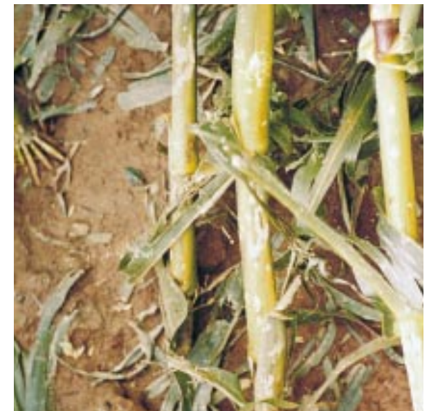
Abgeschlagene Blätter und Blatteile

Unter Blattverlust sind die durch Hagel abgeschlagenen oder bereits eingetrockneten Blätter zu verstehen. Alle noch grünen Blatteile assimilieren weiter. Es ist erstaunlich, dass selbst quer gerissene und lediglich an dünnen Leitungsbahnen hängende Blattflächen noch funktionsfähig bleiben.